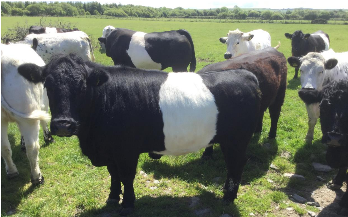
Gwartheg Dre-fach yn mwynhau'r haul ar ôl hirlwm gaeaf. Some of the Dre-fach herd enjoying the sun after a long winter indoors.